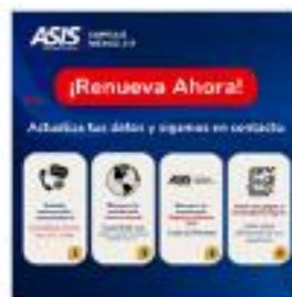
Consulta tu vigencia, no te quedes sin tus beneficios