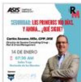
Reunión Mensual Enero 2025