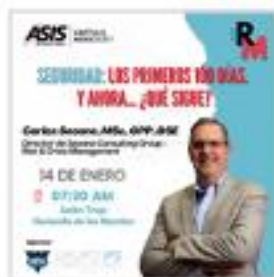
Reunión Mensual Enero 2025