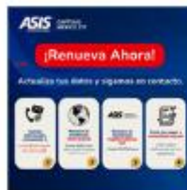
Consulta tu vigencia, no te quedes sin tus beneficios