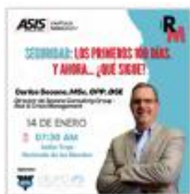
Reunión Mensual Enero 2025