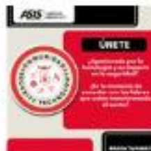
ÚNETE A LA COMUNIDAD DE SECURITY TECHNOLOGY DE ASIS CAPÍTULO MÉXICO