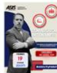
Conversatorio en conjunto - Comunidades Seguridad Escolar & Servicios de Seguridad