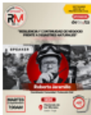
Reunión Mensual Septiembre