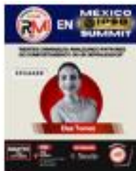
Reunión Mensual Octubre