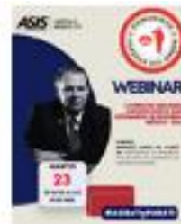
Webinar de la Comunidad Fuerzas del Orden