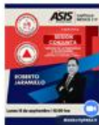
Sesión Conjunta de las Comunidades de Investigaciones e Inteligencia y Protección Civil