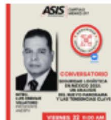
Conversatorio de la Comunidad de Seguridad Logística