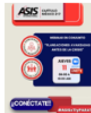
Webinar en Conjunto Comunidad Crisis Management y Comunidad Protección Ejecutiva