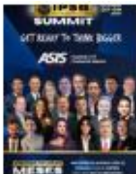
IPSB Mexico Summit