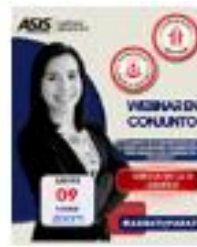
Webinar en Conjunto de las Comunidades Women in Security & NextGen