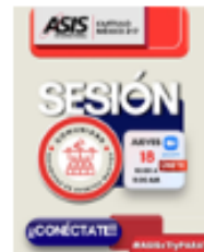
Sesión Comunidad de Seguridad en Eventos Masivos